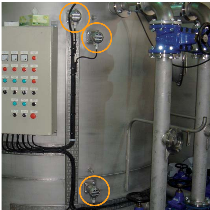
Füllstandschalter Typ: A 01 051E15